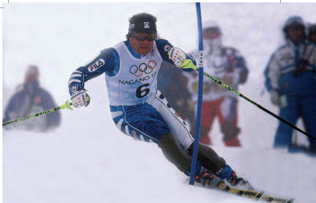
Slalom speciale, Olimpiadi Nagano, 1998