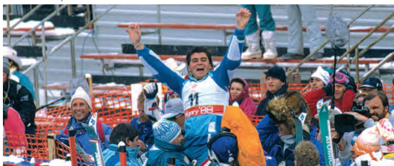
Alberto esulta dopo la vittoria del secondo oro olimpico, Olimpiadi Invernali Calgary, 1988

E invece, per dirla alla Lucio Dalla, Tomba "rinasce come rinasce il ramarro". È la stagione 1991/92: due Coppe del mondo di specialità (in gigante e slalom, con nove vittorie) e altre due