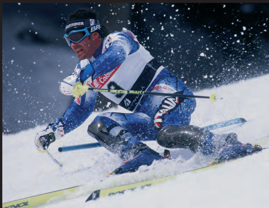
L'ultima vittoria, Grans, Montana, marzo 1998

Tomba è stato il primo (e forse l'unico) sciatore-star, ha messo a frutto le sue doti con ricchi contratti di sponsorizzazione, probabilmente si è divertito. Un bel bottino che si è guadagnato con il sacrificio sacrosanto di ogni atleta, ma soprattutto riuscendo a sopravvivere per 13 anni a una pressione psicologica che avrebbe ammazzato un toro. "Possiedo una qualità che mi ha aiutato moltissimo", spiega. "So sdrammatizzare, in qualunque situazione. E più la situazione si fa difficile, più riesco a rimanere lucido, a concentrarmi e a trovare motivazione per lottare. E poi, certo, ci vuole sacrificio e costanza, ma a me quelli non sono mai mancati, checché ne scrivessero certi giornalisti. Magari non seguivo alla lettera certi consigli, magari arrivavo sul ghiacciaio per gli allenamenti un'ora dopo, ma stai sicuro che in quel caso ero l'ultimo ad andarmene: ognuno ha i suoi ritmi ed è giusto che li segua. Anche adesso penso sia stata una fortuna che in tante occasioni abbia fatto di testa mia nella preparazione".