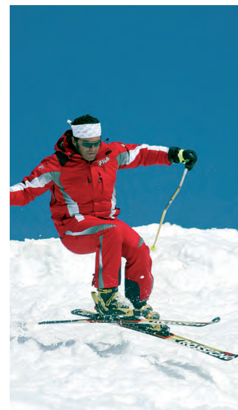
Slalom gigante, Olimpiadi Invernali di Nagano, 1998

Una rivincita dunque, che si ripete nel 1996, quando Alberto riesce a centrare il doppio oro anche ai Campionati del mondo di Sierra Nevada, una competizione che fino a quel momento (a proposito di scaramanzia), gli aveva sempre portato sfortuna. È dopo quel traguardo che l'entourage di Tomba inizia a pianificare il ritiro del campione, dosando sapientemente sport e marketing. "Io però tenevo a una cosa: volevo chiudere con una vittoria a tutti i costi", ricorda Alberto. "Posso garantire che sarei andato comunque avanti finché non ce l'avessi fatta. Era per una questione d'orgoglio sia verso i miei tifosi, che verso me stesso". La vittoria arriva, eccome se arriva: 15 marzo 1998, Crans Montana, ultima gara della stagione e ultima gara di Alberto. Per chi non è scaramantico non significherà molto, ma a Crans Montana, una mattina di 11 anni prima Alberto aveva vinto la sua prima medaglia importante, quella dei Mondiali '87.